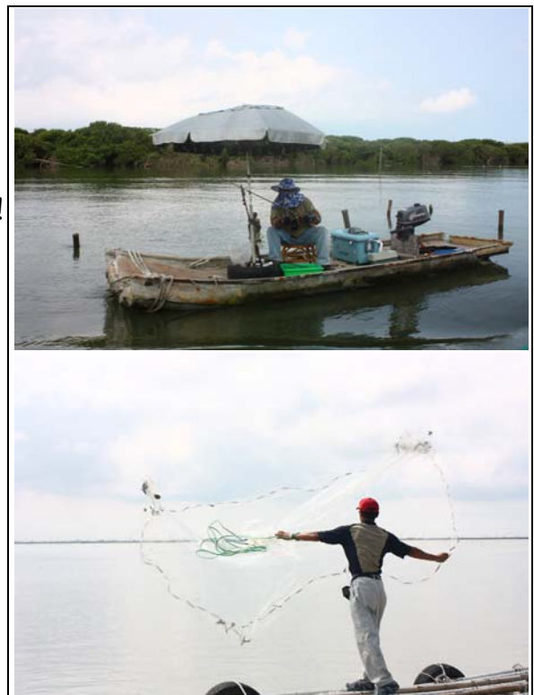
圖：蚵仔人家的生活。

蚵仔不僅健康美味，也是當地居民的營生，更是在台灣西部的歷史中佔據重要地位，構成此地獨特美麗的景觀與內涵。