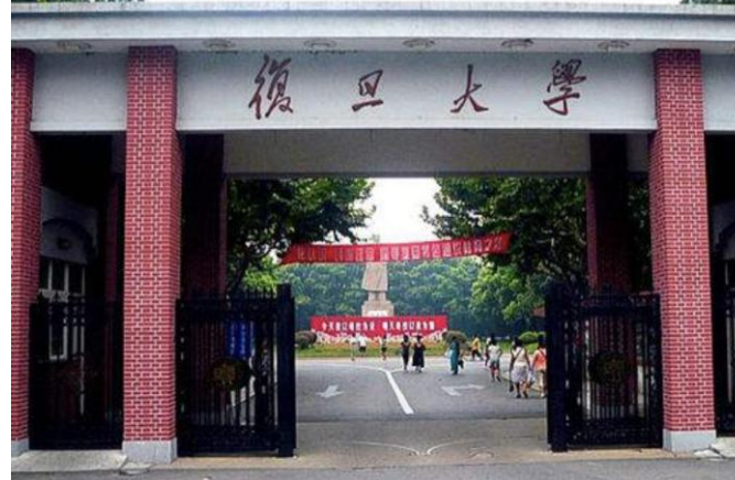
圖3：復旦大學校訓石